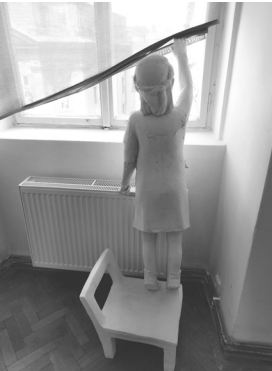
Galerie hl. města Prahy – Collaredo-Mansfeldský palác Médium: Figura